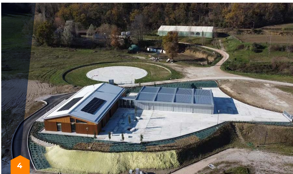
Costruzione del Centro polifunzionale di Protezione Civile a Comunanza (AP)

MC: La nomina del dott. Giovanni Legnini a commissario delegato ha sicuramente dato nuovo slancio alle attività pubbliche di ricostruzione nel periodo 2020-2023, e confidiamo nel fatto che il nuovo Commissario il Sen. Guido Castelli proeguirà tale trend positivo. In quanto Società Nazionale di Croce Rossa, non essendo un ente pubblico amministrativo, non abbiamo potuto beneficiare, almeno fino ad oggi, degli speciali poteri derogatori. Tuttavia, con l'Ordinanza Speciale 19 del 15 luglio 2021 del Commissario Straordinario, per gli importanti risultati conseguiti, la Croce Rossa Italiana è stata nominata per la prima volta 'soggetto attuatore' per la realizzazione di un centro sportivo polifunzionale ad Arquata del Tronto). Si tratta di un riconoscimento importante del lavoro svolto, che ci dà grandi responsabilità, oltre all'opportunità di testare sul campo l'efficacia dei cosiddetti "poteri speciali". Oggi, avendo aggiudicato la procedura di gara in soli cinque mesi (con l'inconveniente di una prima fase andata "deserta") riteniamo di aver ben adempiuto all'incarico conferito, oltre che di poter confermare l'efficacia delle deroghe concesse dal Commissario.