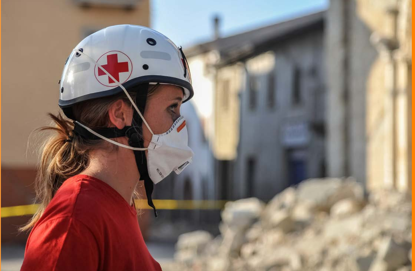
Una volontaria della Croce Rossa Italiana

Ripresa e Resilienza (PNRR) approvato nel 2021 e finanziato dall'UE al fine di rilanciare il Paese a seguito della pandemia di Covid-19, è stato destinato un Fondo complementare aggiuntivo rispetto alle risorse già stanziato per la ricostruzione pubblica e privata, destinato a tutte le aree del Centro Italia colpite dagli eventi sismici negli ultimi anni, e da attuare entro dicembre 2026. 41