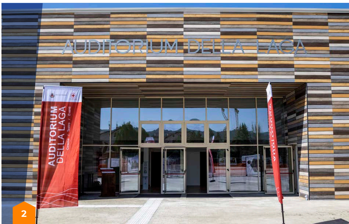
Auditorium realizzato nel Centro polifunzionale di Amatrice, finalizzato a creare un luogo di cultura, scambio e formazione dove ritrovarsi come comunità

nelle quattro regioni colpite. Cosa ha comportato dover operare in un modello di governance complesso e multilivello come quello previsto dal DL 189/2016? Puoi farci degli esempi?