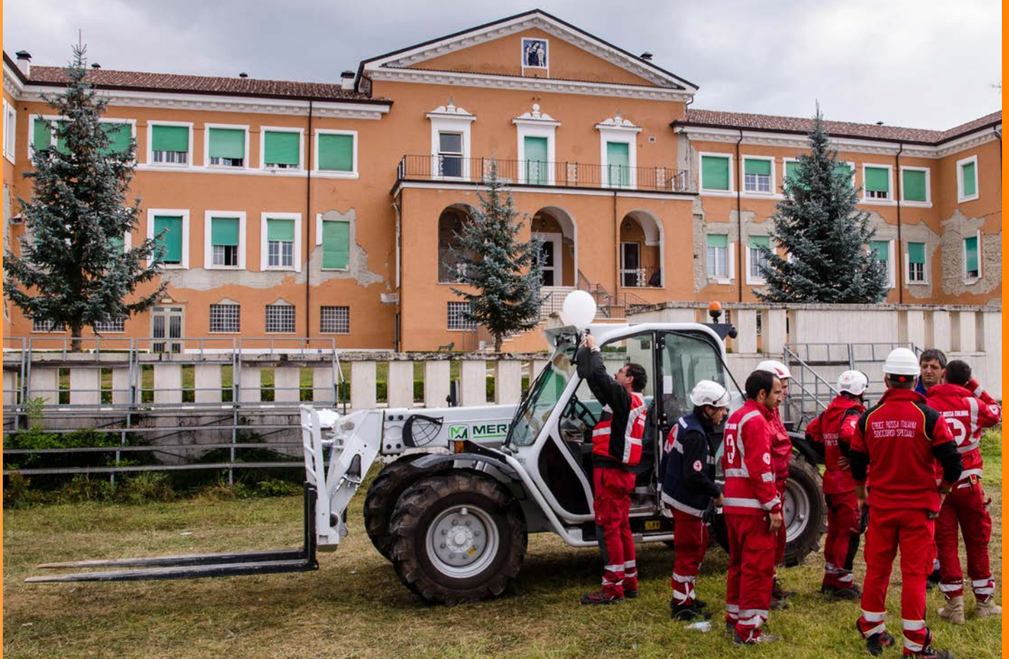
Volontari e personale della Croce Rossa Italiana impegnati nella fase di ripresa post-terremoto, a fianco della popolazione di Amatrice (Lazio)

La realizzazione di un modello di governance ad hoc può così favorire una maggiore adattabilità di tali processi alle specificità e alle istanze espresse da parte delle comunità coinvolte, anche grazie ad accordi e partnership tra le amministrazioni pubbliche e i principali portatori di interesse come i privati o le categorie tecniche e professionali.