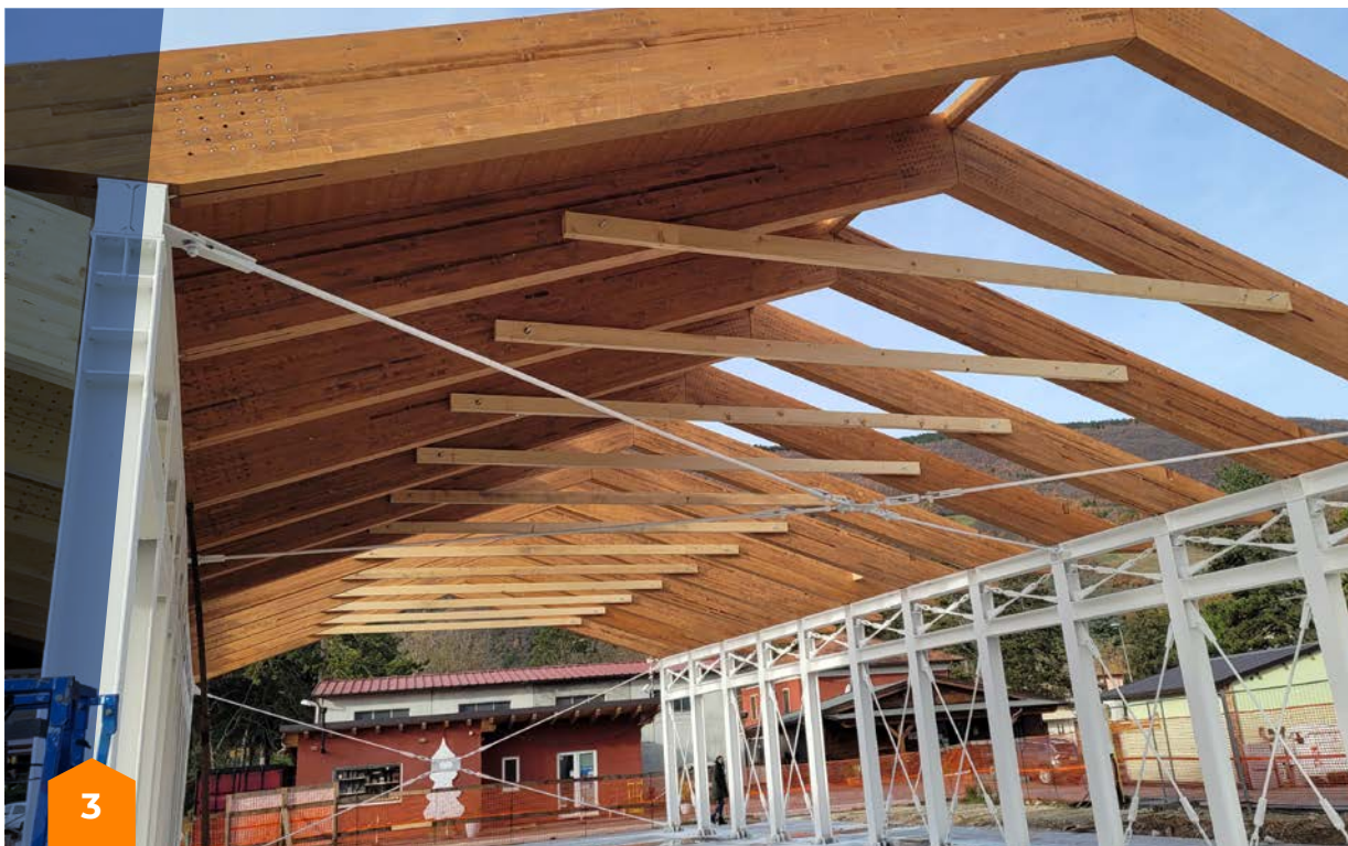
Centro polifunzionale di Muccia, comprensivo di una biblioteca, spazi polivalenti finalizzati all'aggregazione sociale e alla fornitura di servizi ambulatoriali.

Questi ci hanno aiutato a ottimizzare, snellire e velocizzare il nostro lavoro, con risultati molto soddisfacenti rispetto agli obiettivi precedenti. Resta il rammarico per il ritardo accumulato in fase progettuale, anche se, rispetto al quadro generale della ricostruzione, le nostre tempistiche appaiono più veloci della media dei lavori pubblici. Anzi, è quasi assimilabile a quelli della ricostruzione privata, soprattutto considerando che queste ultime operano al di fuori delle disposizioni normative del D.lgs 50/2016. Da questo punto di vista, i risultati in termini di lavori realizzati in sei anni sono molto significativi.