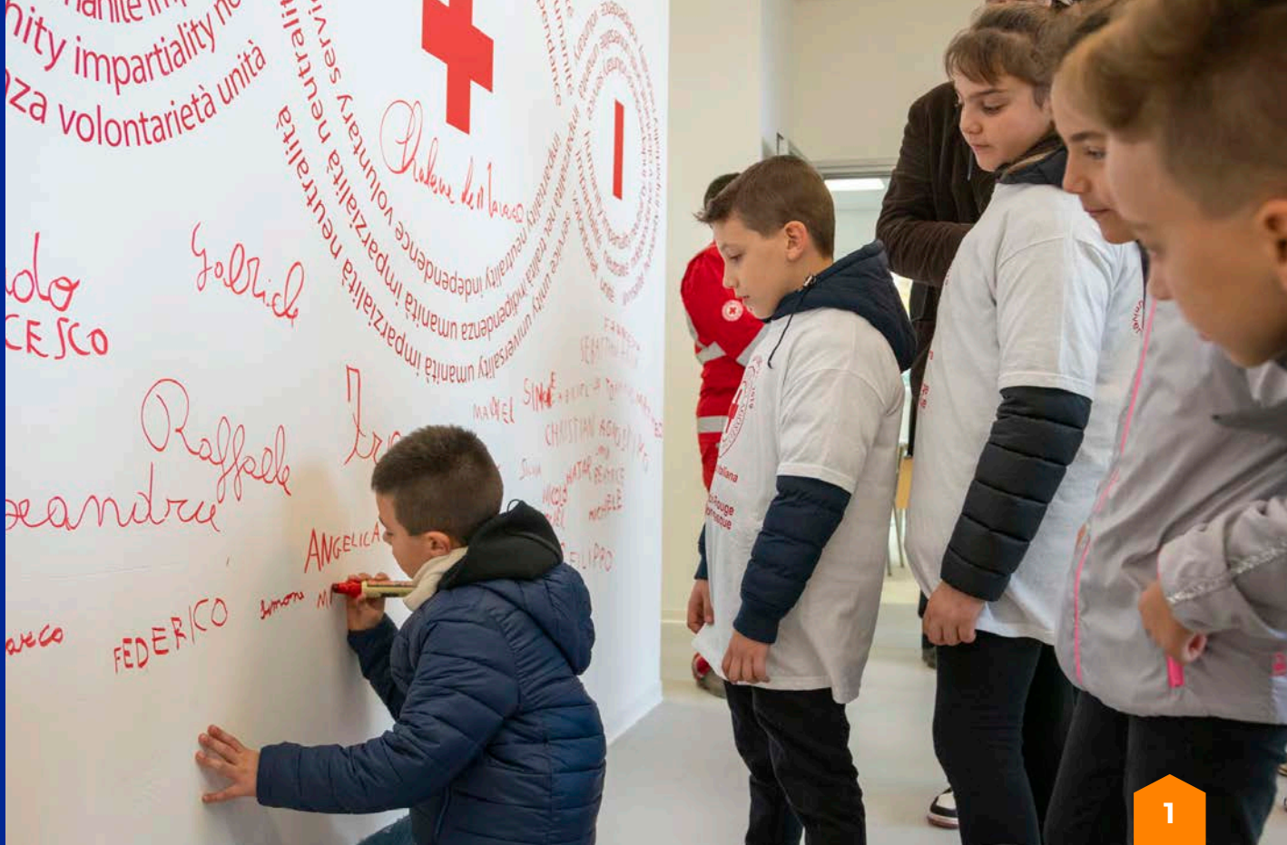
Riapertura della scuola elementare di Isola del Gran Sasso d'Italia