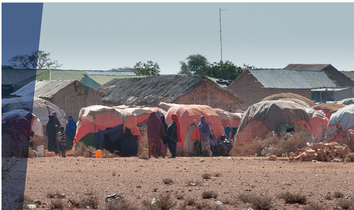
Un campo per sfollati interni sorto vicino al villaggio di Tukaraq nella regione di Sool (Somalia)

Altri strumenti internazionali giuridicamente non vincolanti, ma comunque in grado di esercitare 'effetti normativi' sugli attori coinvolti (c.d. soft law ) rappresentano un punto di riferimento importante. Oltre alla Sendai Framework di cui si è dato conto, tra questi si possono annoverare le risoluzioni approvate nel corso degli anni da parte dell'Assemblea Generale dell'ONU, la cui prima e poi importante in materia (UNGA Ris. 46/182 del 1991) ha stabilito come già nella fase emergenziale post-catastrofe si dovessero considerare le ricadute in termini di riabilitazione e ricostruzione successive, con un occhio allo sviluppo futuro (paragrafi 9, 40, 41).